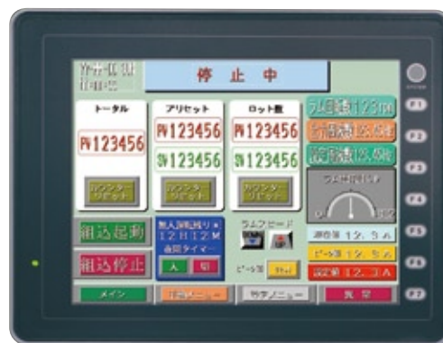
タッチパネル (オプション) Touch panel (optional)

Offers a full array of functions in a compact format, with screen switching performed at a touch.